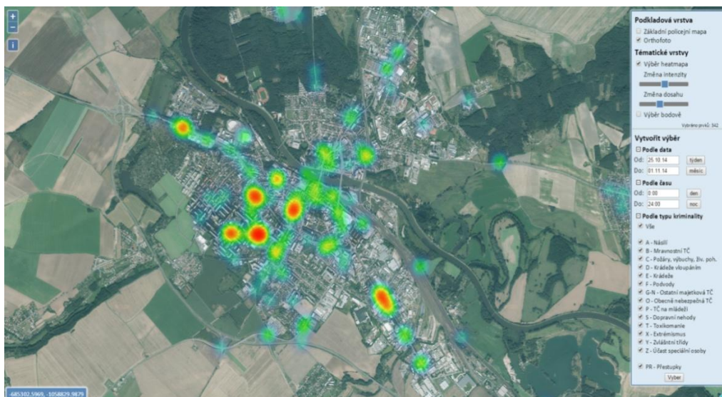
Ilustrační obrázek – mapa Hot spot

Kolínská policie zastává názor, že občan žijící v určitém místě, by měl být informován o kriminálních činech v této oblasti a tedy i o případných budoucích rizicích, které mu mohou potencionálně hrozit. Z tohoto důvodu policie přistoupila ke zveřejňování neznámých trestných činů na území Kolína na webových stránkách města „Bezpečný Kolín“, který byl zřízen mimo jiné i k těmto účelům. Na tomto webu je rovněž plánováno zveřejnění mapy Kolína s vytyčenými oblastmi, kde budou zobrazeny vybrané druhy trestné činnosti. Místo trestného činu bude rozostřeno v sektoru cca 200 m 2 , tak aby nebylo možné identifikovat osobu poškozeného, a tím nedocházelo k sekundární viktimizaci.